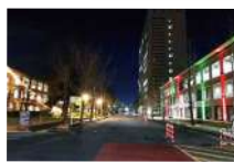
キャンパスイルミネーション