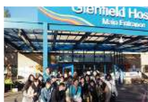
キャリアアップ実習(英国)