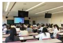
新入生オリエンテーション